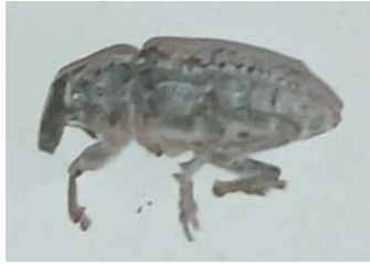
Рисунок 2. Обыкновенный свекловичный долгоносик ( Bothynoderes punctiventris Germ.)

3. Иванов, Е.В. Предварительные итоги работы свеклосахарного комплекса в 2024 году / Е.В. Иванов // Сахарная свекла. - 2025. - № 2. - С. 2-6.